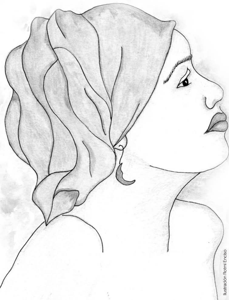
Ilustración Rotmi Enciso

...los y las jóvenes también tienen “derecho a tener derechos”